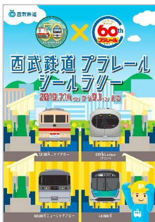
ラリーシートイメージ (表)

ステップ 2 「ラリーシート引換券」を最初に向かうラリーシート引換駅にて「ラリーシート」に引換え、異なるシールを全4駅分集め、西武ちちプラレール駅(西武秩父駅)のお客さまご案内カウンターにて「ラリーシート」を提示すると、達成賞(西武秩父線 50th×プラレール 60th オリジナル下敷き、B5サイズ)をプレゼントします。