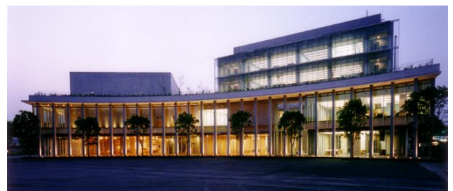
プラレール プレイランド（イメージ）（上）と 秩父市歴史文化伝承館（下）