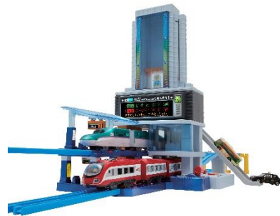
のぼってくだって立体交差!! メガ駅ビル（8月発売予定）