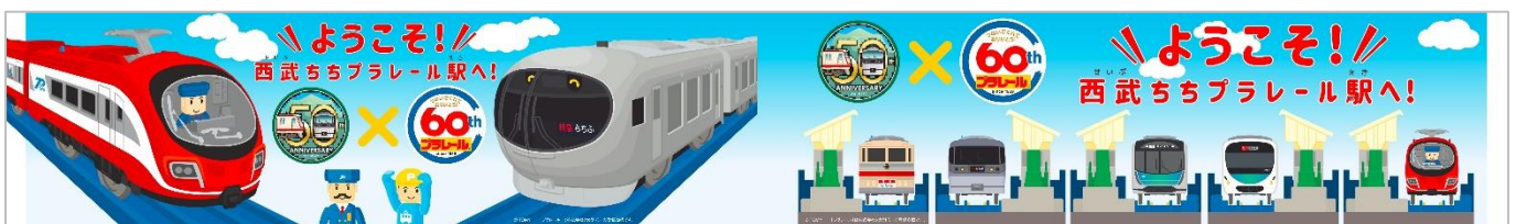
柱巻き看板イメージ