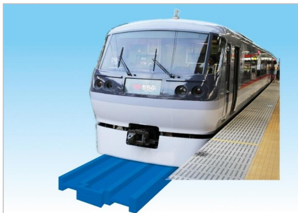
【1/1 プラレールの世界を体験】（イメージ）