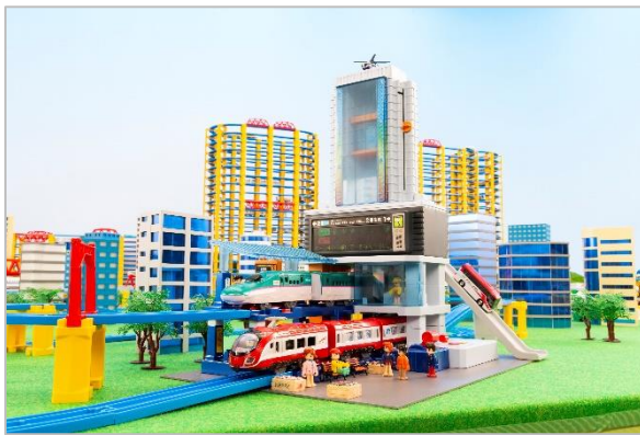
ジオラマイメージ