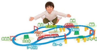
レールも！車両も！情景も！ 60周年ベストセレクションセット