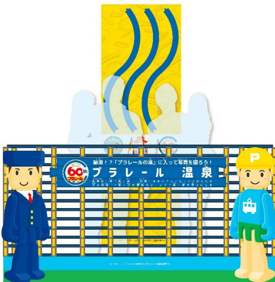
プラレール 湯舟ジオラマ（イメージ）

その他、西武秩父駅前温泉 祭の湯 ちちぶみやげ市（物販エリア）では、“鉄”分が補給できる？プラレール 湯舟が出現、また秩父市歴史文化伝承館1階には、プラレール プレイランドがオープンします。