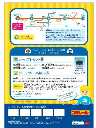
ラリーシートイメージ (裏)