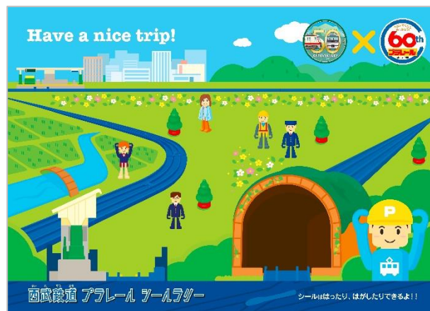
ラリーシートイメージ (中面)