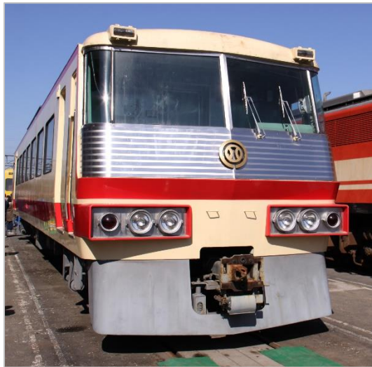
5000系前頭部展示イメージ