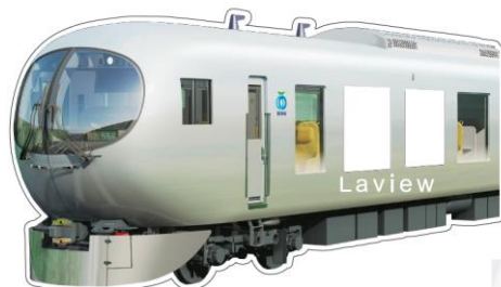
001系Laviewステッカー イメージ