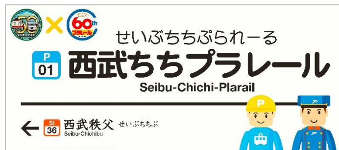
駅名看板イメージ